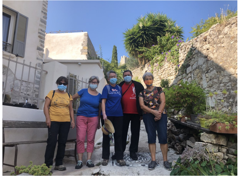
Animateurs en repérage

Première Balade de la Section « Balade » du Phénix Ollioulais le 8 octobre 2020.