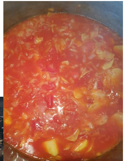
Tourin a la tomate